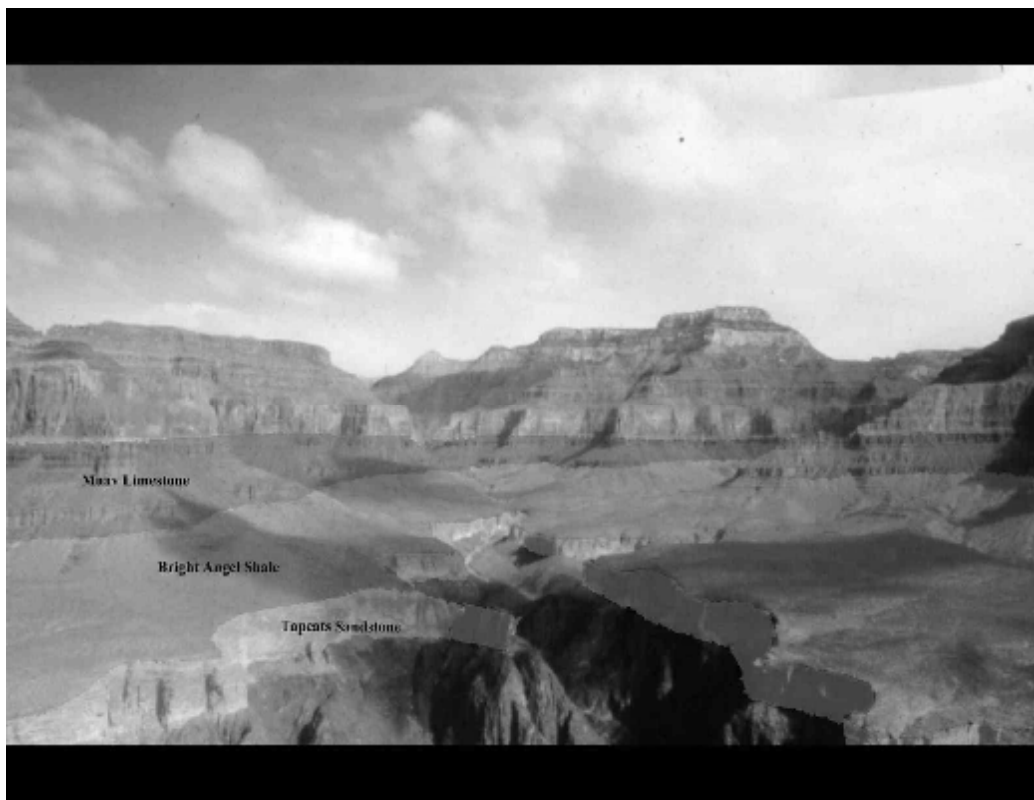
Figura 2 – Imagem que demonstra como as camadas da terra se dispõem como se fossem camadas de um “bolo”, denotando que foram depositadas de forma rápida e ordenada, por densidade volumétrica.