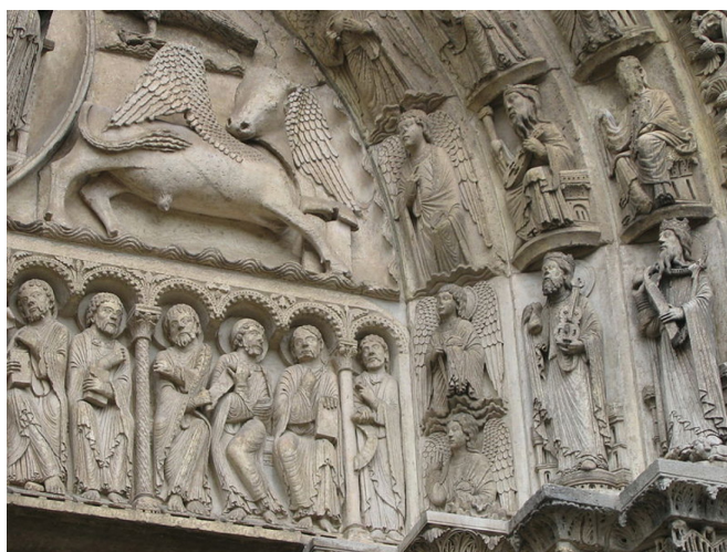
Imagem 3. Detalhe dos anciãos no tímpano principal da Catedral de Chartres.