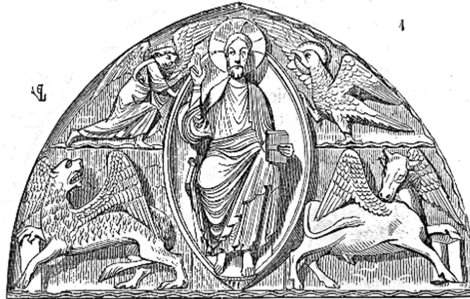
Figura 4. Ilustração de Viollet-le-Duc do tímpano principal da Catedral de Chartres.