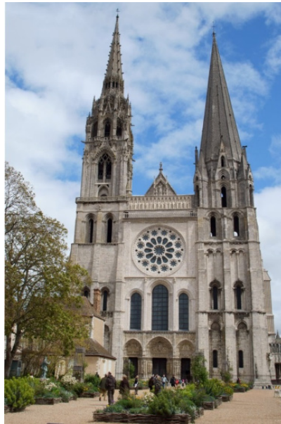
Figura 1. Notre Dame de Chartres